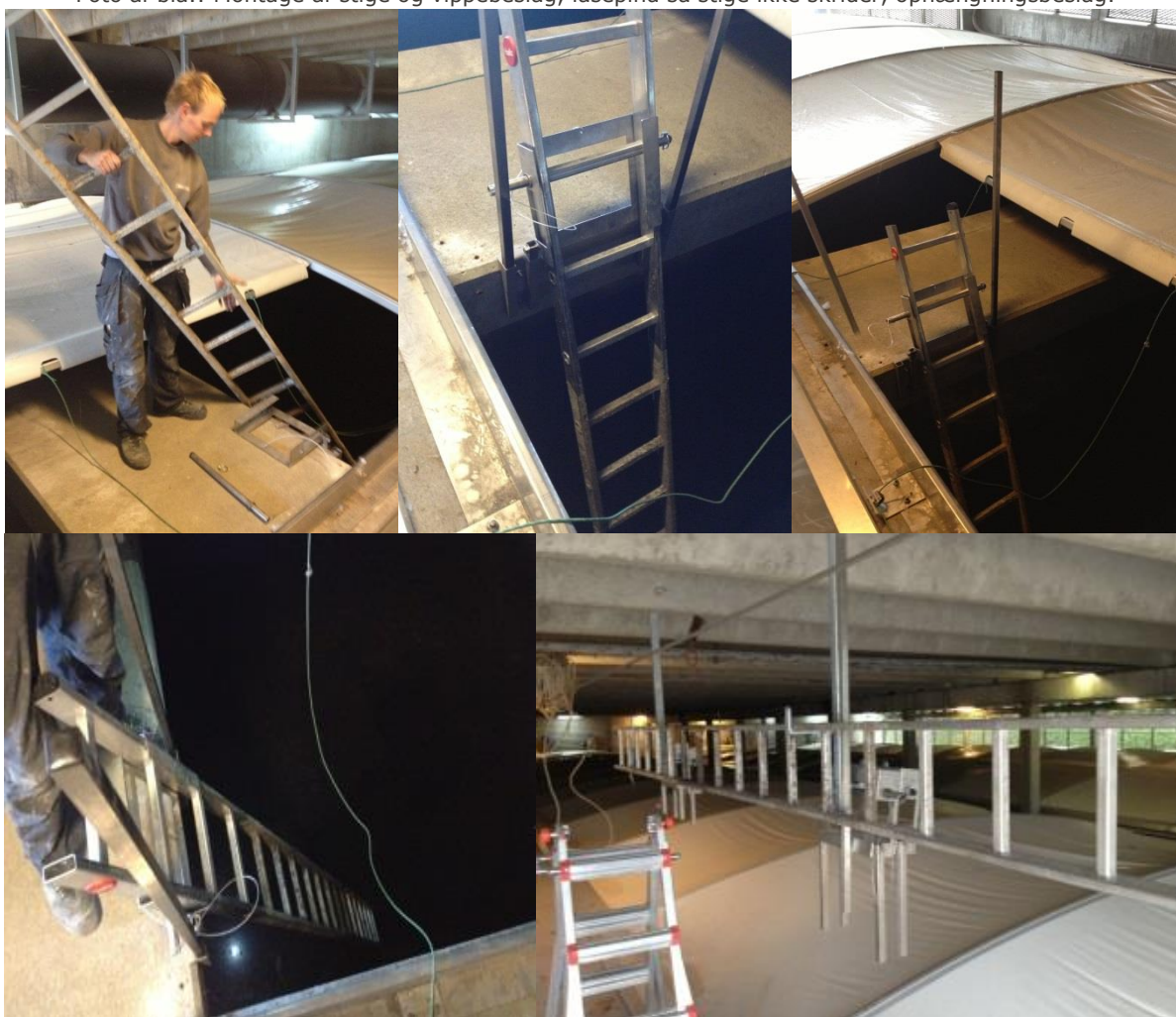
Foto af bla.: Montage af stige og vippebeslag, låsepind så stige ikke skrider, ophængningsbeslag.

Kontakt os for en løsning på jeres næste projekt.